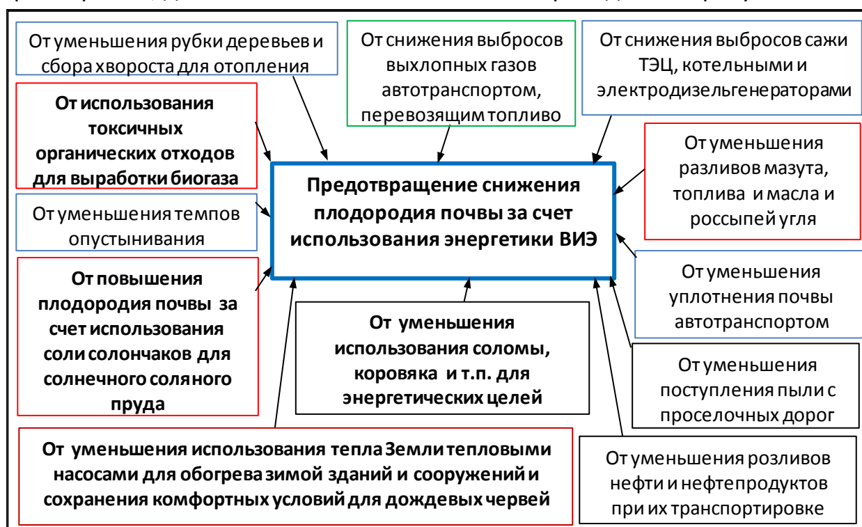
Рисунок 1 – Структура предотвращенного снижения плодородия почвы за счет использования отдельно взятой системы и установки энергетики ВИЭ

При определении для зональной экосистемы эколого-социально-экономической эффективности любой из технологий энергетики ВИЭ, нельзя пренебрегать, дополнительными показателями приведены на рисунке 1.